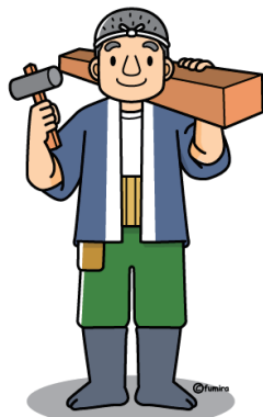
組合員ご本人 (組合職員も可)